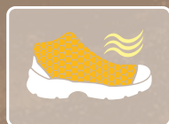
EVACUACIÓN DE LA HUMEDAD