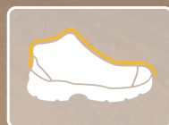
RESISTENTE A IMPACTOS