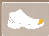
PUNTERA DE COMPOSITE