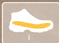
PLANTILLA TEXTIL ANTIPERFORANTE