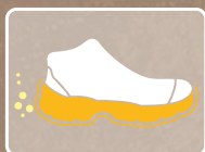
RESISTENTE A LOS Y SUS DERIVADOS HIDROCARBUROS